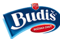
Budiš, a. s.