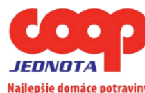
COOP Jednota Slovensko, spotrebné družstvo