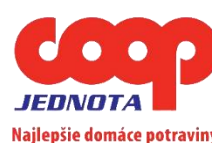
COOP Jednota Slovensko, spotrebné družstvo