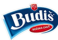
Budiš, a. s.