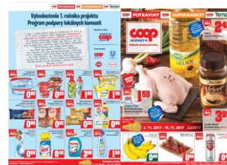
IN POTRAVINY č. 22