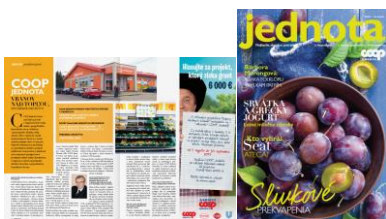
časopis Jednota č. 6