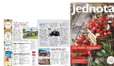
časopis Jednota č. 11