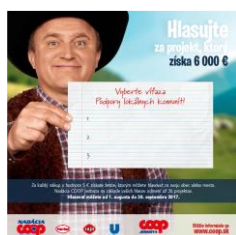
plagát na urne