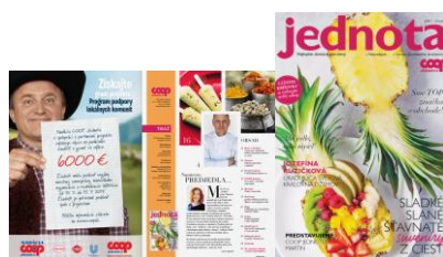
časopis Jednota č. 8