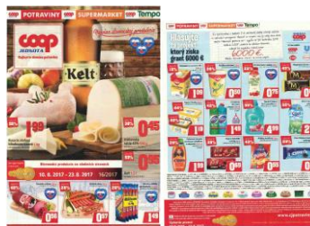
IN POTRAVINY č. 16