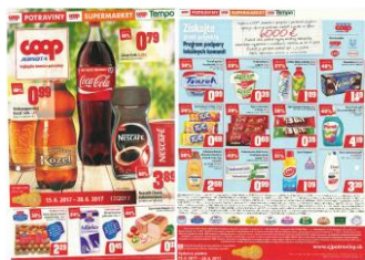
IN POTRAVINY č. 12